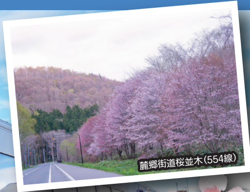
麓郷街道桜並木(554線)