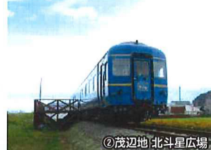
1988~2015年に上野・札幌間で運行されていた寝台特急【北斗星】の客車2両をかつて走っていた沿線の北斗市茂辺地で保存・展示しています。