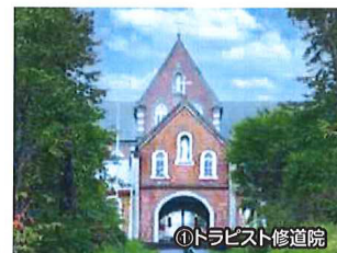
1896年(明治29年)に設立された男子修道院。修道院では開塾・農耕・牧畜が盛んにおこなわれ、ここでつくったバターやクッキー、バターパンは北海道を代表する観光みやげ品として知られています。