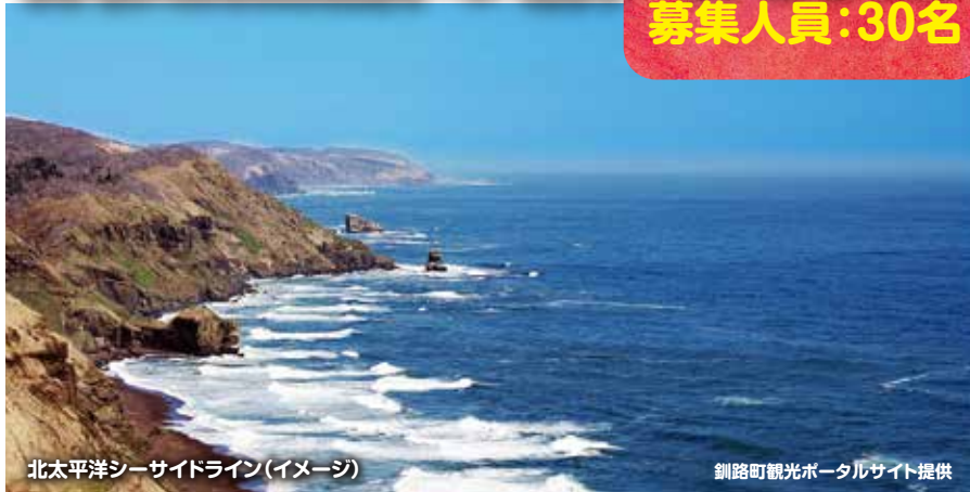
北太平洋シーサイドライン(イメージ)