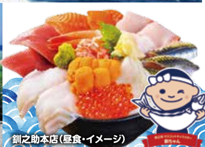
釧之助本店(昼食・イメージ)