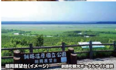
細岡展望台(イメージ)