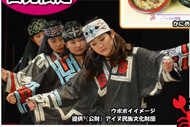
ウポポイイメージ