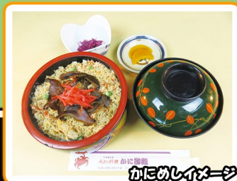
かにめしイメージ