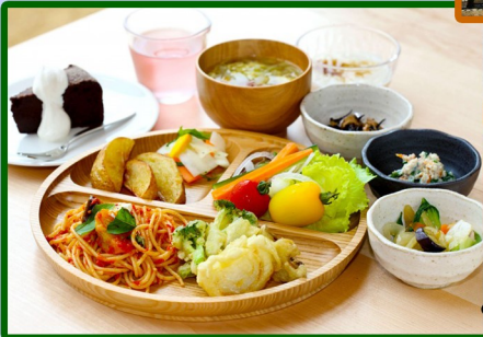
くるるの社のランチフックフェイメージ

大人おひとり様 (税込) 9,000円 どうみん割 適用で 4,000円 (税込)