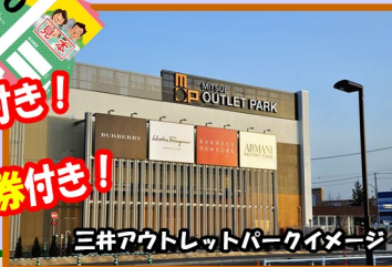
三井アウトレットパークイメージ