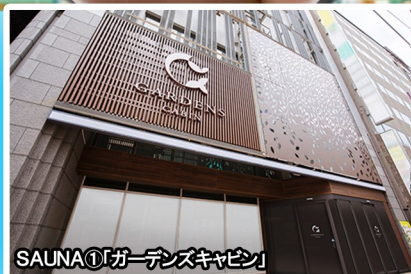
SAUNA①「ガーデンズキャビン」