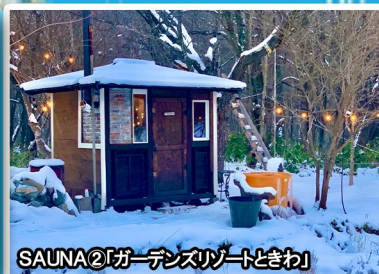
SAUNA②「ガーデンズリゾートときわ」