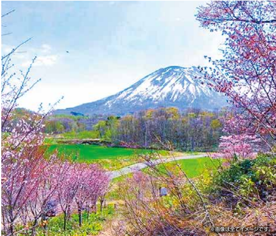
※画像は全てイメージです。

羊蹄山を眺めながら天然露天風呂と、北海道の旬の食材を生かした彩り豊かな品々の昼食をぜひお楽しみください。コーヒー、紅茶、ソフトドリンク飲み放題付きです。