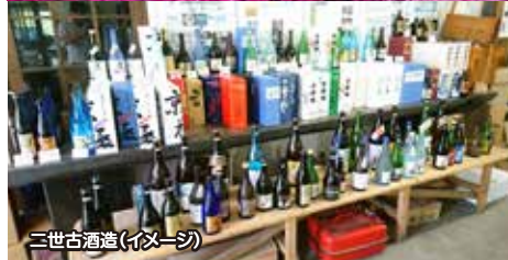
二世古酒造(イメージ)