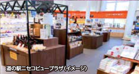
道の駅ニセコビュープラザ(イメージ)