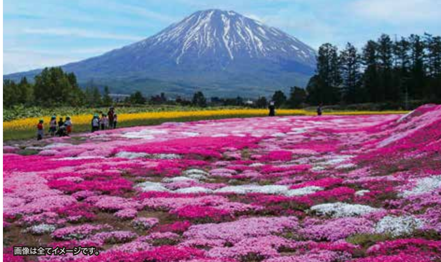
画像は全てイメージです。