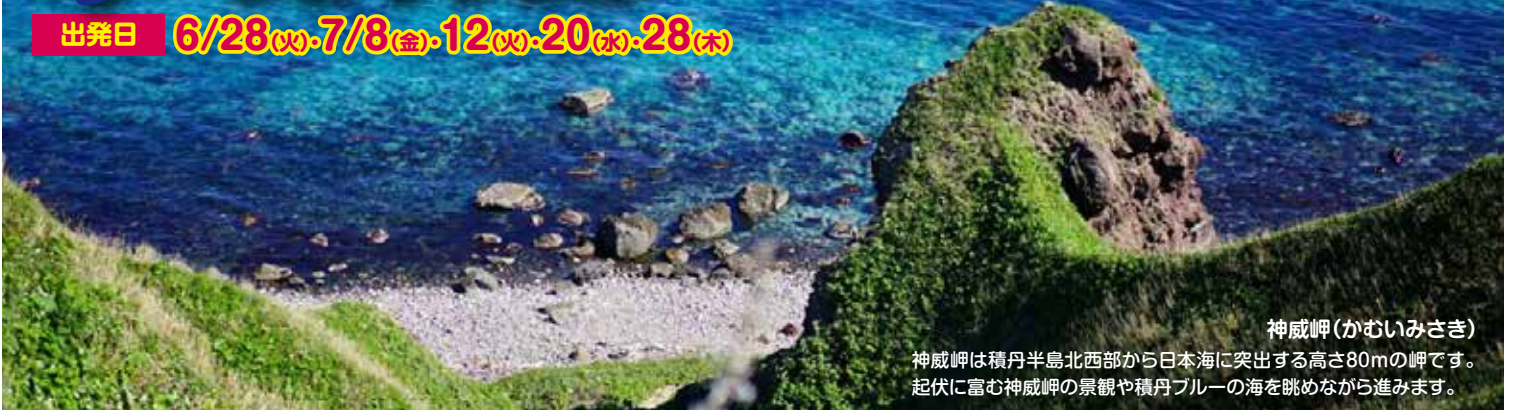
神威岬(かむいみさき)

神威岬は積丹半島北西部から日本海に突出する高さ80mの岬です。起伏に富む神威岬の景観や積丹ブルーの海を眺めながら進みます。