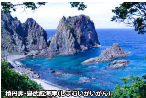
積丹岬・島武威海岸(しまむいかいがん)

神威岬は積丹半島北西部から日本海に突出する高さ80mの岬です。起伏に富む神威岬の景観や積丹ブルーの海を眺めながら進みます。