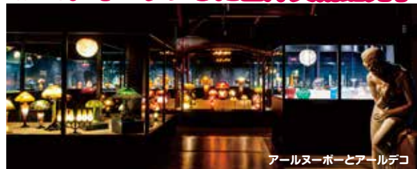
アールヌーボーとアールデコ

小樽運河のほとりに位置する旧浪倉倉庫を活用した大空間の中で、欧米のステンドグラスや、アールヌーヴォー・アールデコのガラス工芸品、家具などの西洋美術品をお楽しみいただける美術館です。