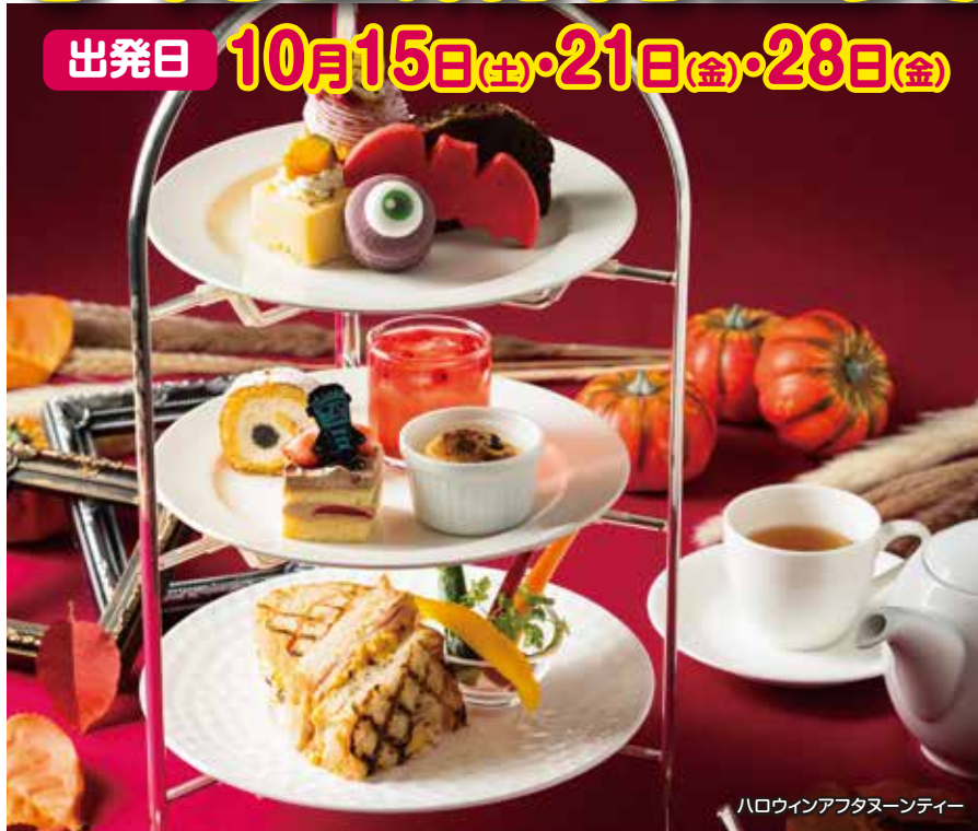
ハロウィンアフタヌーンティー