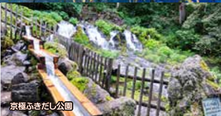
京極ふきだし公園