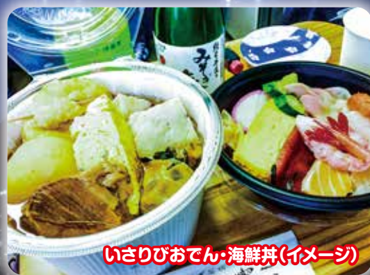
いさりびおでん・海鮮丼(イメージ)