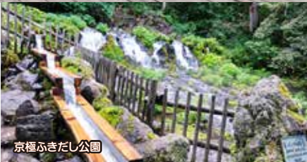
京極ふきだし公園