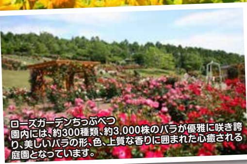
ローズガーデンちっぶべつ 園内には、約300種類、約3,000株のバラが優雅に咲き誇り、美しいバラの形、色、上質な香りに囲まれた心癒される庭園となっています。