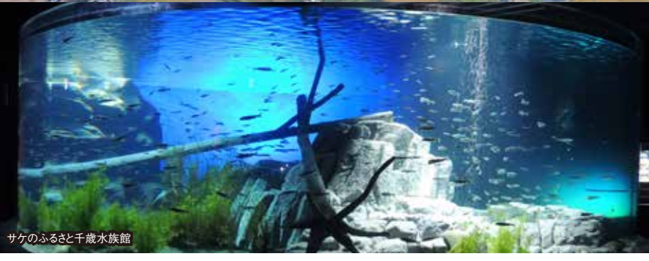
サケのふるさと千歳水族館