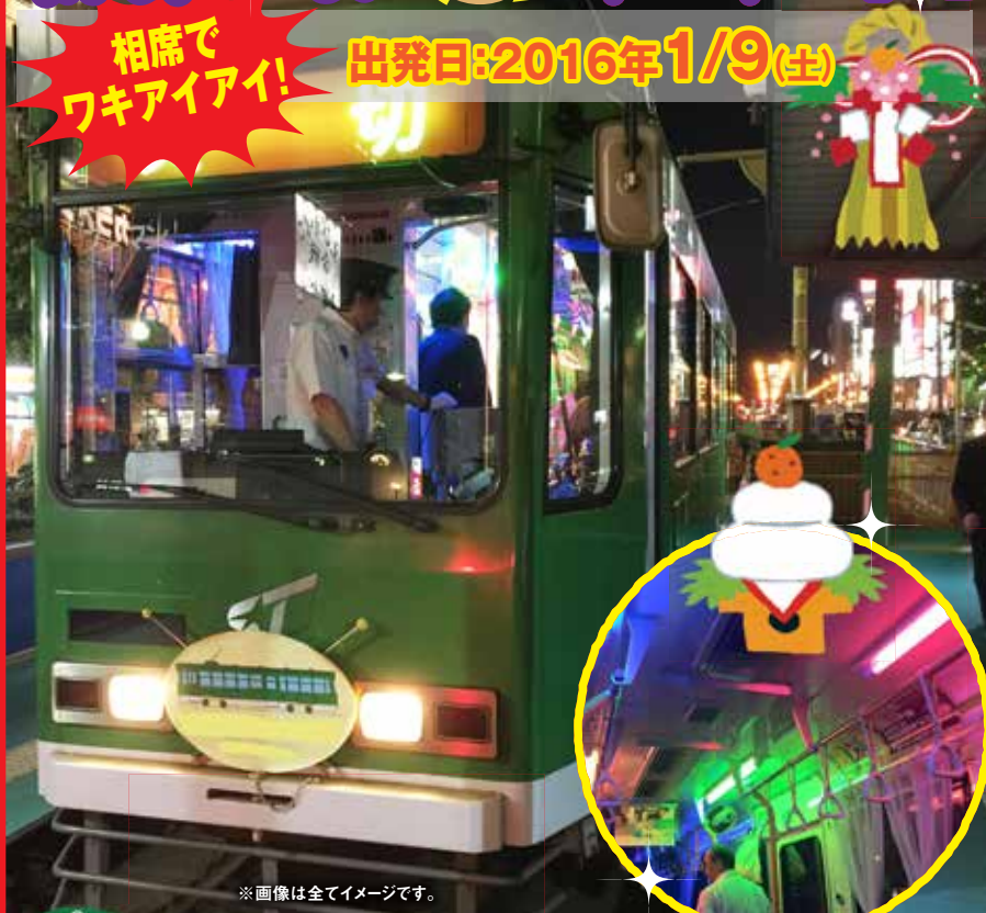
※画像は全てイメージです。