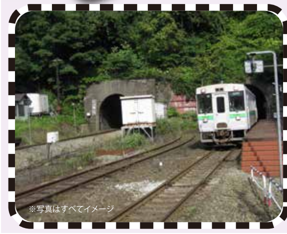
※写真はすべてイメージ