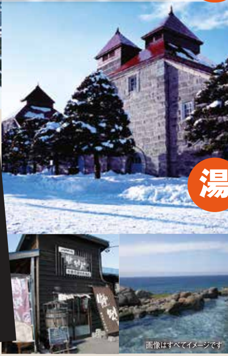
画像はすべてイメージです