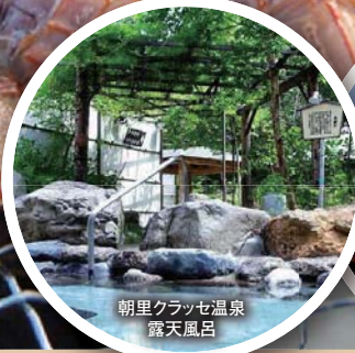
朝里クラッセ温泉 露天風呂