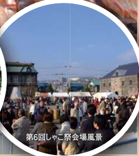
第7回しゃご祭会場風景