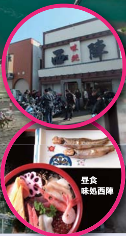
画像はすべてイメージです