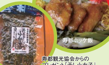
寿都観光協会からのプレゼント「干し小女子」