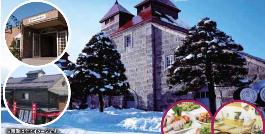
*画像は全てイメージです。

おひとりでご参加の方にはおひとり様同志、バスにて相席をご用意!旅の出会い話に花が咲きます!