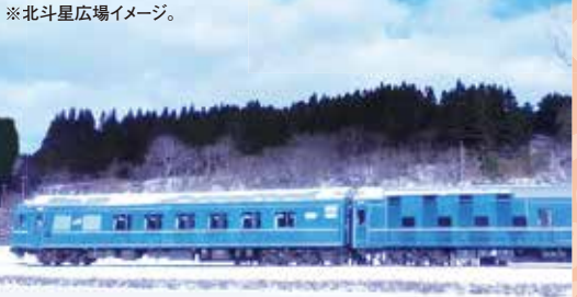
※北斗星広場イメージ。

開業以来、大好評の観光列車「ながまれ海峡号」が日台友好特別列車として特別運行します。今回の企画は、日本と台湾の鉄道愛好家が列車に集い、北斗市茂辺地地区に保存された寝台特急のメモリアルの地「北斗星広場」で交流します。雪あそびや名物海鮮鍋と地元郷土料理などでお楽しみいただきます。