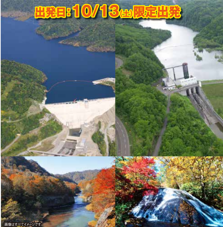
画像はすべてイメージです