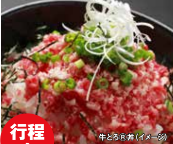
牛とろ@丼(イメージ)