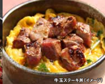
牛玉ステーキ丼(イメージ)