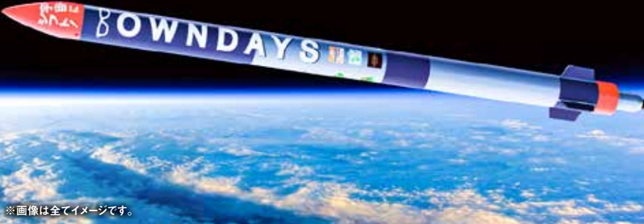
※画像は全てイメージです。

ロケット打上げについて 当ツアーはロケット打上げの見学を保証するものではありません。当日天候や諸事情によりロケット打上げが行われない場合でも当ツアーは実施いたします。その場合のご旅行代金の返金等はございません。旅行代金には打上げ協力金が含まれています。