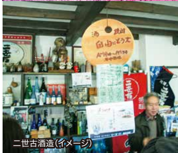
二世古酒造(イネージ)