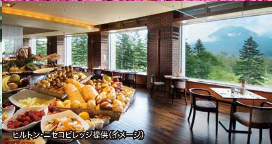
ヒルトン・ニセコビレッジ提供(イネージ)