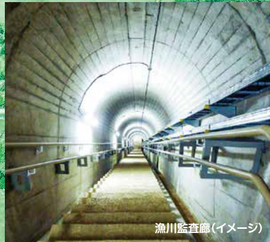
画像はすべてイメージです