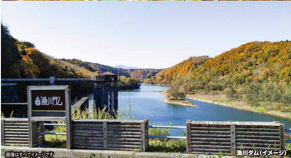
漁川ダム(イメージ)