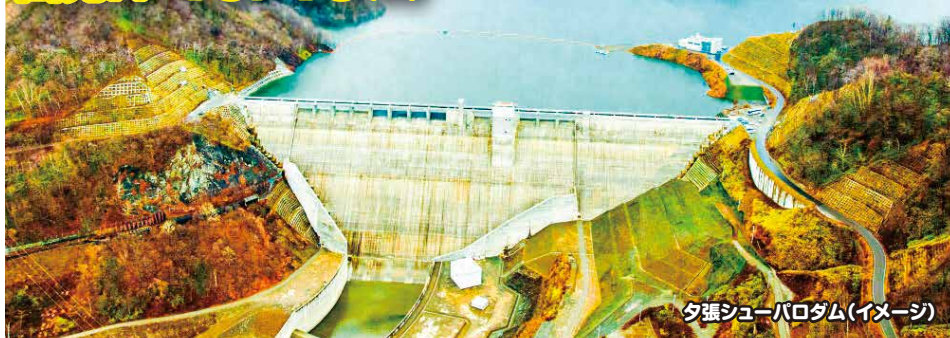
夕張シューパロダム(イメージ)