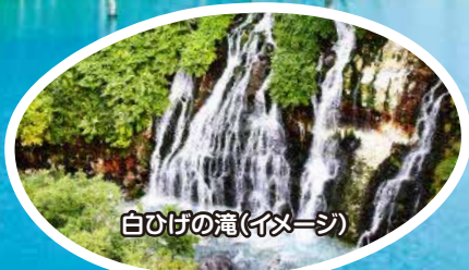
白ひげの滝(イメージ)

10/25(日)・31(土) 11/6(金)・22(日)・28(土) 12/4(金)・10(木)