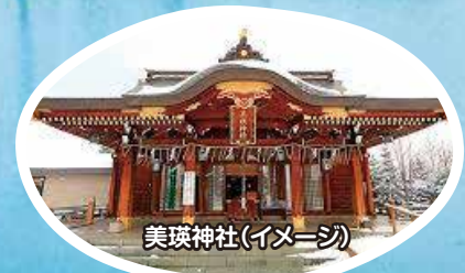
美瑛神社(イメージ)