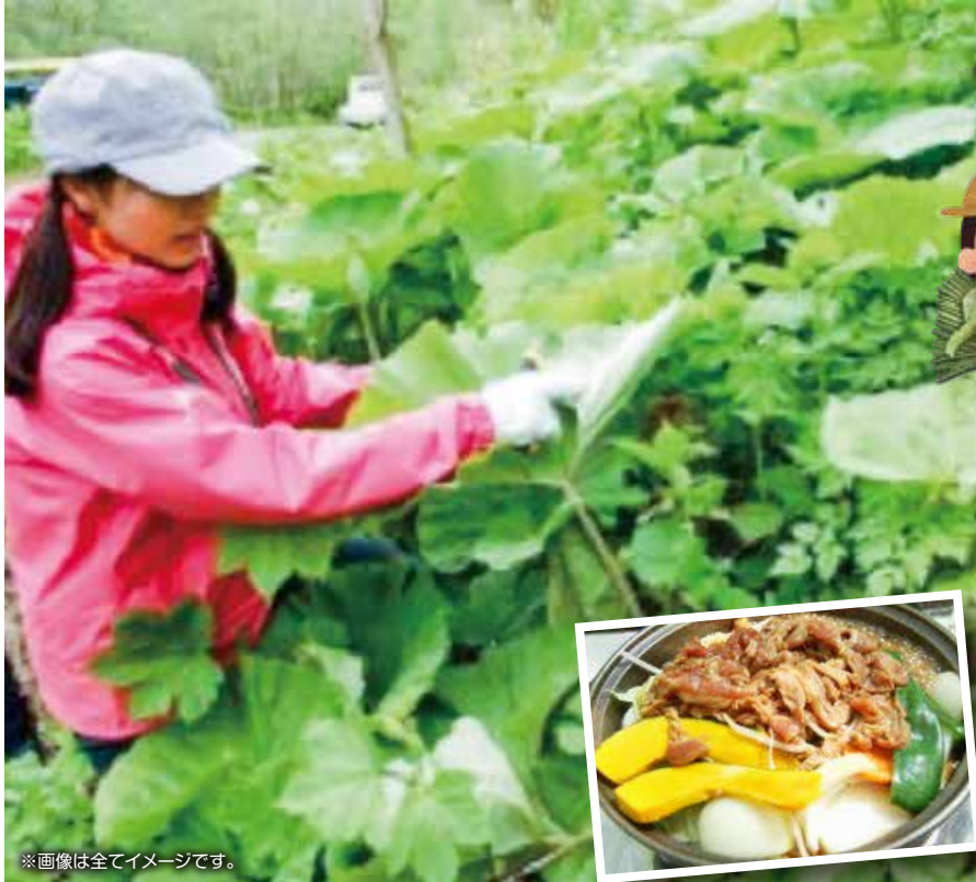
※画像は全てイメージです。

小樽駅から約26キロ仁木町の南高台に位置し、総面積20ヘクタール(札幌ドーム約4個分)のうちサクランボ畑が約15ヘクタールで、サクランボの木が約4000本(20種類)あります。6月末~10月末までサクランボ、プラム、ブドウ、リンゴ、ブルーベリーなどの果物狩りが楽しめます。今回は、果物狩りシーズン前に「フキ」採りを楽しんでいただきます。