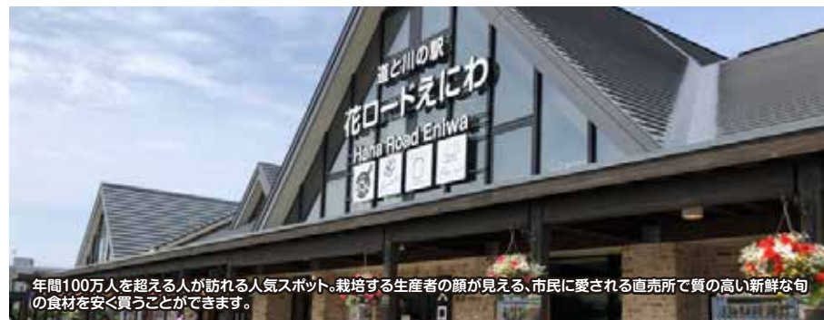
年間100万人を超える人が訪れる人気スポット。栽培する生産者の顔が見える、市民に愛される直売所で質の高い新鮮な旬の食材を安く買うことができます。