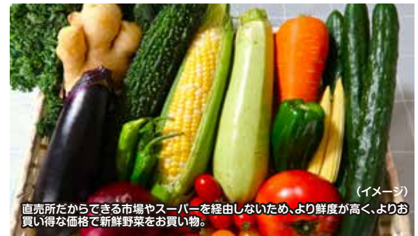
(イメージ) 直売所だからできる市場やスーパーを bypass しないため、より鮮度が高く、よりお買い得な価格で新鮮野菜をお買い物。