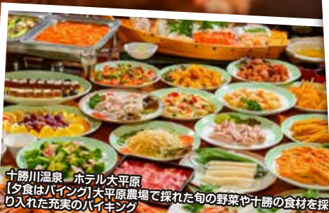
十勝川温泉 ホテル大平原 【夕食はバイキング】大平原農場で採れた旬の野菜や十勝の食材を採り入れた充実のバイキング