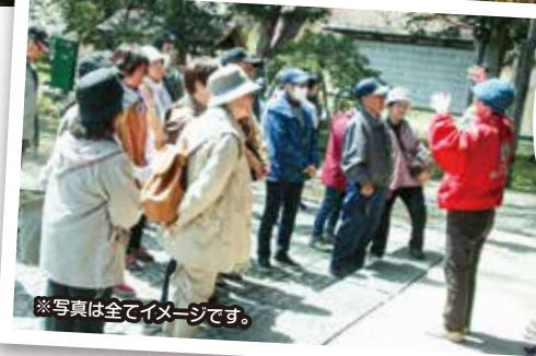
※写真は全てイメージです。